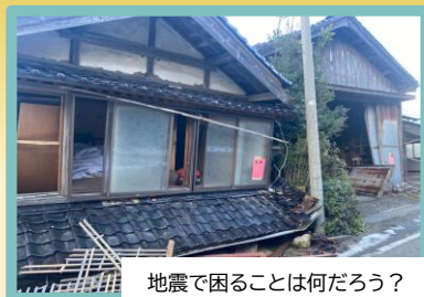
地震で困ることは何だろう？