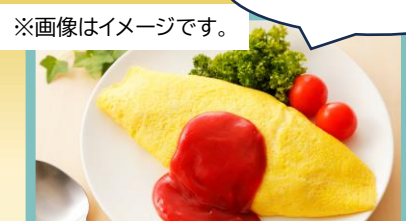
ポテチを使ったオムライス作りに挑戦!!